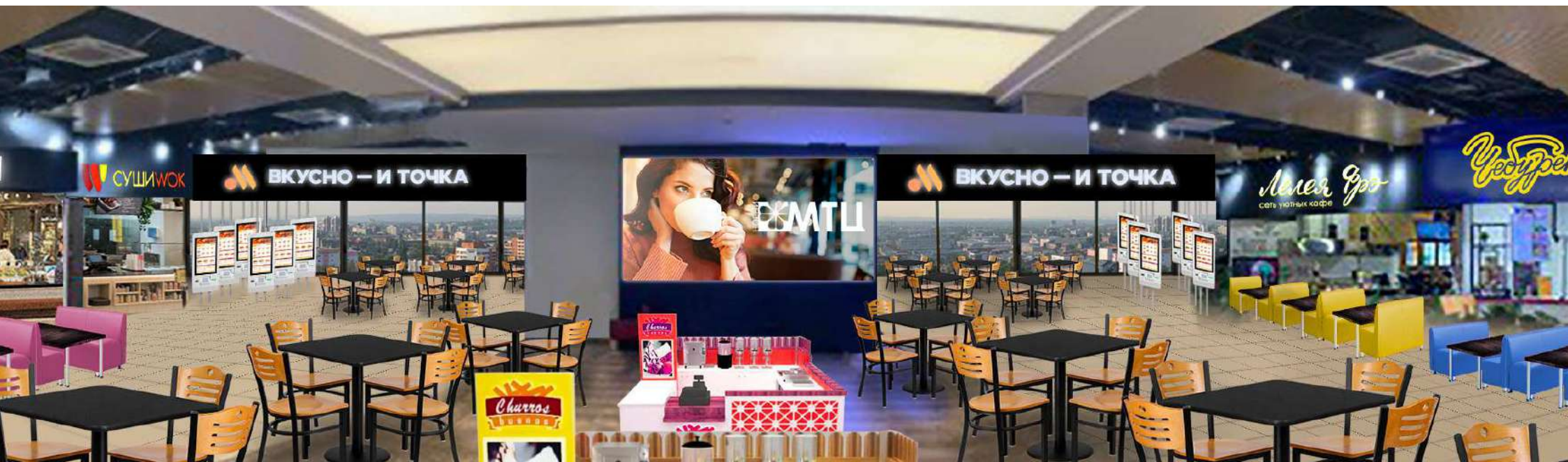
Вариант брендинга павильона на примере сети ресторанов быстрого питания "Вкусно и точка"